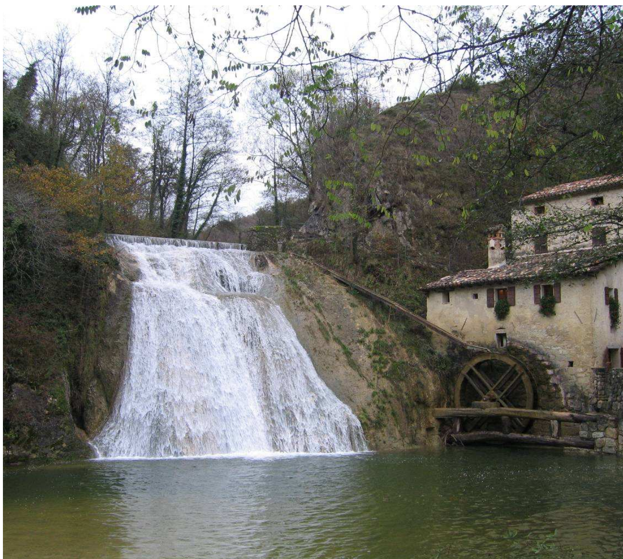
Un mulino ad acqua

La necessità di analizzare il paesaggio culturale tramite studi e ricerche interdisciplinari, che approfondiscano la conoscenza dei suoi elementi fondanti